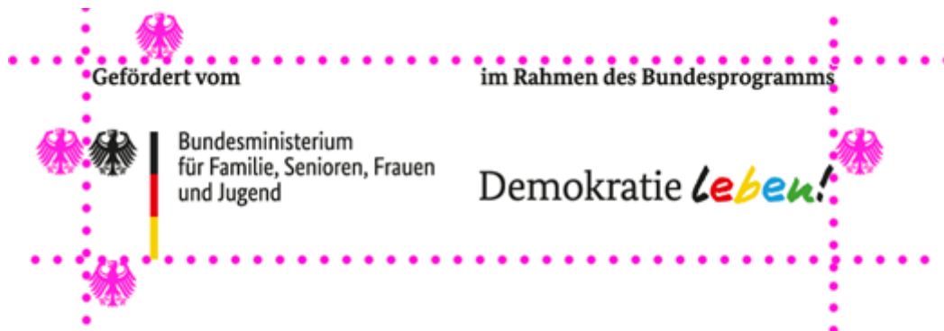
Illustration: Schutzraum um das Logo

in der kein anderes Element platziert werden darf. Die Schutzzone hat zu jeder Seite hin die Breite von einem Adlerelement.